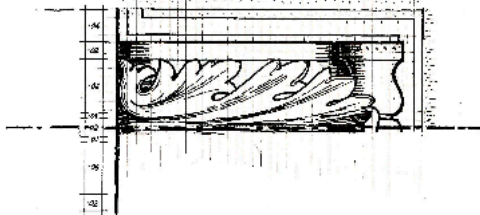
PIANTA DAL BASSO